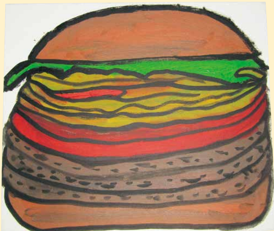
「ハンバーガー」 さかくち しんいちろう 坂口 真一郎