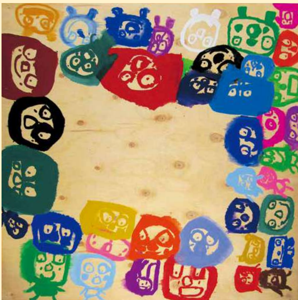
「なかまいっぱい」 すぎやま まさひろ 杉山 将大